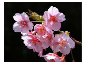
花言葉：優れた美人