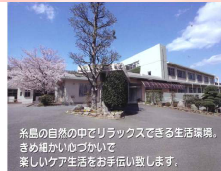
糸島の中でリラックスできる生活環境。 きめ細かい心づかいで 楽しいケア生活をお手伝い致します。

ホワイトデーは、バレンタイン教からひと月後、その男女はあらためて二人の永遠の愛を誓い合ったという話に由来する。ヨーロッパをはじめ、世界中の多くの人々に語り継がれ、「ポピーデー」「フラワーデー」「クッキーマンデー」「マシュマロデー」と呼ばれていた。日本では、全国飴菓子工業組合の1978年名古屋総会において「ホワイトデー」と定めて1980年3月14日から始まった。3月14日になったのは「古事記」や「日本書紀」から日本の飴製造の起源を拾ったとする説もある。